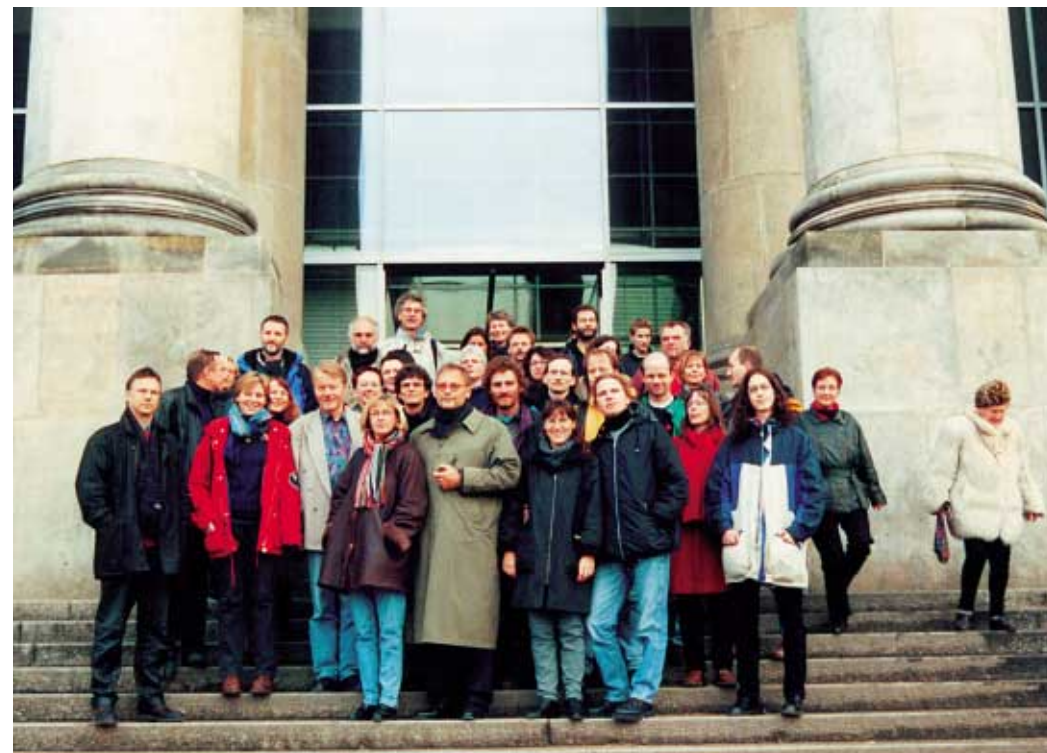
Berlin ist eine Reise wert. Regelmäßig besuchten Gruppen aus Münster Winni Nachtwei, der sie gern im Reichstag empfing.

Als Mitglied der Staatengemeinschaft musste die Bundesregierung direkt auf akute Gewaltbedrohungen reagieren – auf ein drohendes „zweites Bosnien“ im Kosovo, auf die terroristische Bedrohung durch Al Qaida. Doch die Grünen bleiben Friedens- und Menschenrechtspartei. Das zeigt sich praktisch: in